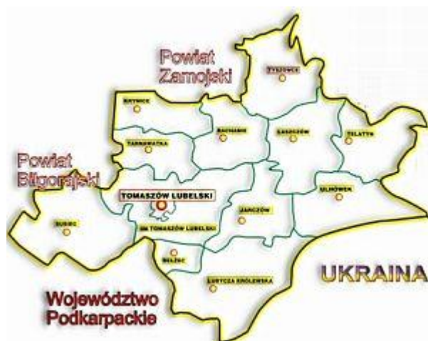
Ryc. 2 Topografia Gminy Susiec

Powierzchnia całej gminy wynosi 190,52 km 2 .. Powierzchnia lasów i gruntów leśnych ogółem wynosi 102,88 km 2 , co stanowi 54% ogólnej powierzchni całej gminy. Powierzchnia użytków rolnych ogółem wynosi 78,11 km 2 , stanowią one 41% ogólnej powierzchni gminy. Pozostałe grunty i nieużytki ogółem wynoszą 9,53 km 2 , czyli 5% ogólnej powierzchni gminy.